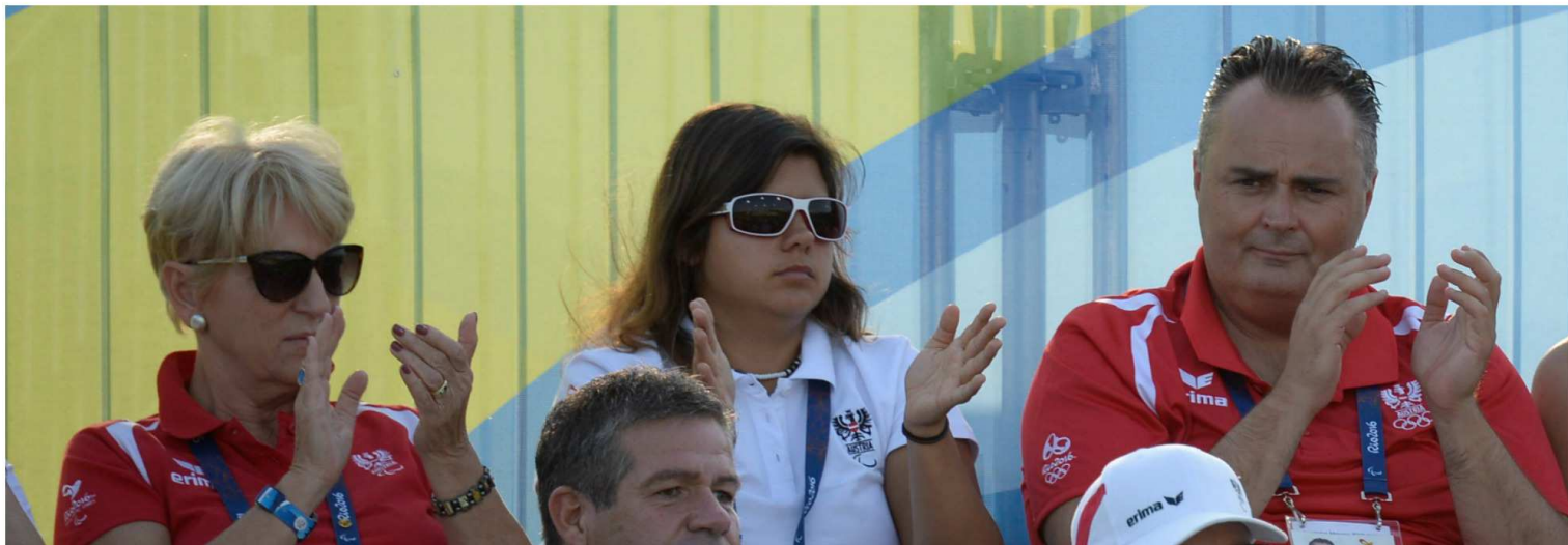
ÖPC-Präsidentin Maria Rauch-Kallat (links) mit Sportminister Hans Peter Doskozil auf der Zuschauer-Tribüne beim Tennis