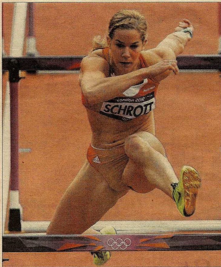
Sportlerin des Jahres. Die St. Pöltnerin Beate Schrott begeisterte mit ihrem Hürdensprint bei den Olympischen Spielen in London.